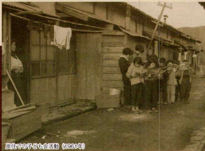
炭住での子ども会活動 (1961年)