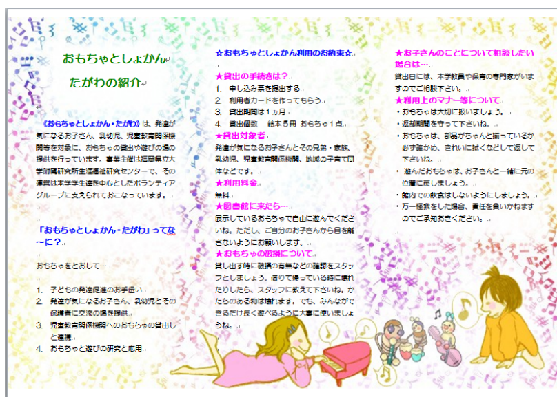
おもちゃとしゃかん たがわパンフレット 裏面